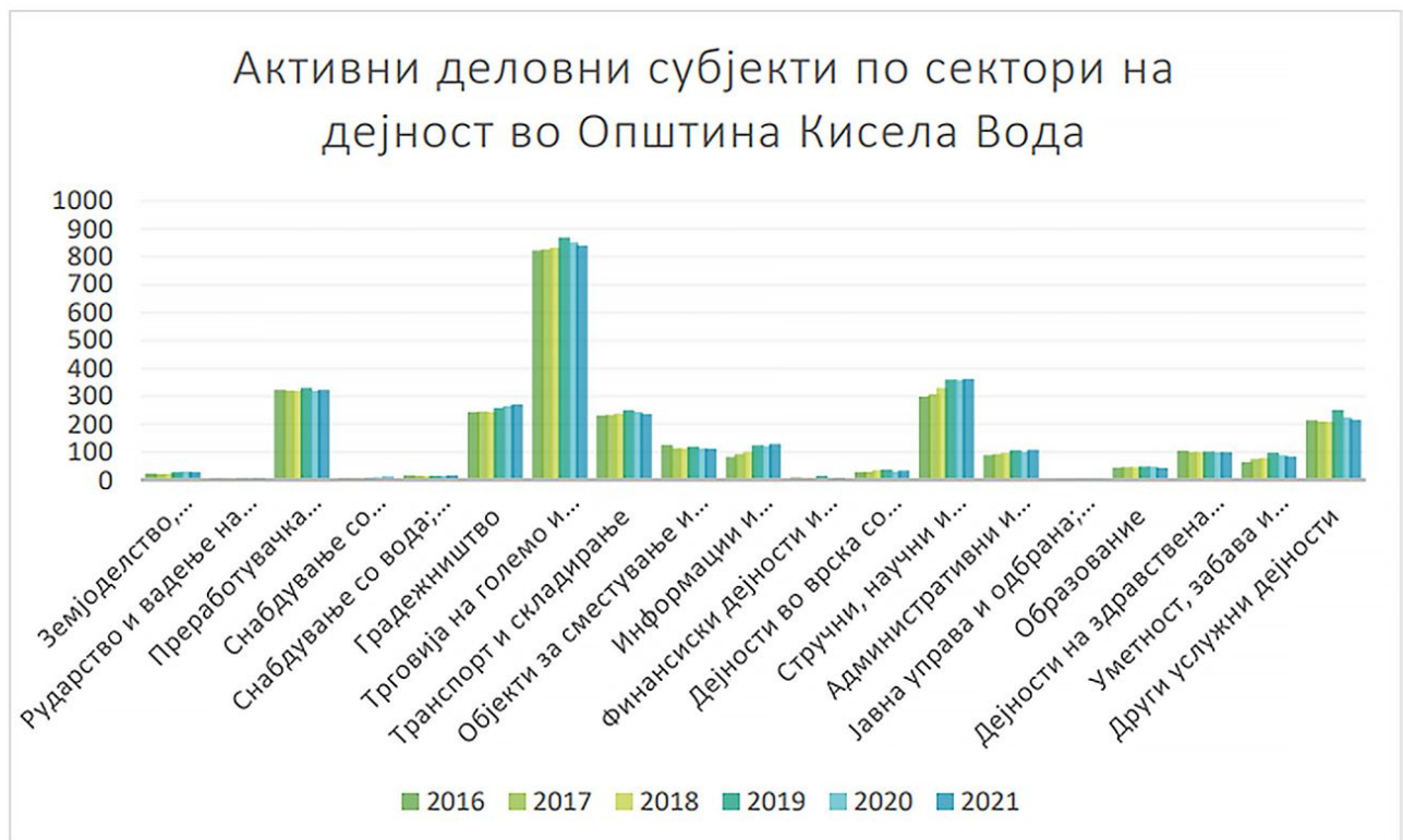
Слика бр. 4 – Активни деловни субјекти во општина Кисела Вода по дејности по години 8

Од нив, најзастапени се 841 се трговија на големо и трговија на мало; поправка на моторни возила и мотоцикли, 324 Преработувачка индустрија, 237 Транспорт и складирање, 361 Стручни, научни и технички дејности итн (слика 4). Забележан е пад по дејностите по годините кој најверојатно се должи и на Ковид 19 пандемијата која драстично се одрази на економскиот сектор.