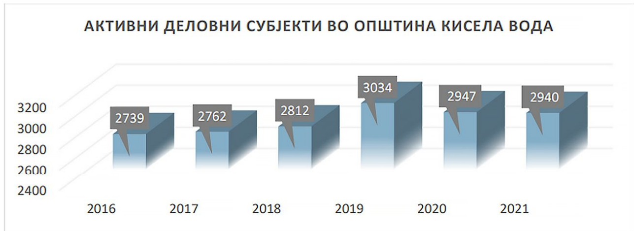
Слика бр. 3 – Број на активни деловни субјекти во општина Кисела Вода 7

Вкупниот број на економски субјекти или активни деловни субјекти според сектори на дејност кои делувале на територија на општина Кисела Вода во текот на 2021 година е 2940. (Слика бр. 3)